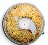
passato verdure vegetables purée