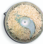
mozzarella pizza mozzarella grating