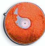
passato di pomodoro tomato sauce