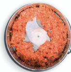
carne per ragù meat mincing