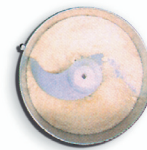
pane grattugiato breadcrumbs