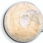
impasti teneri per dolci soft mixtures