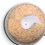
frutta secca dried fruit-nuts